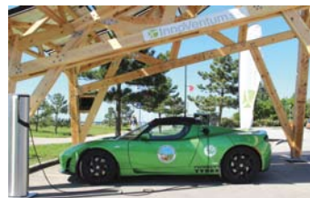
Giraffe から充電のテスラモーター社 Roadster マルメ市 : Tesla Roadster charging electricity from Giraffe, Giraffe installation in Malmo, Sweden