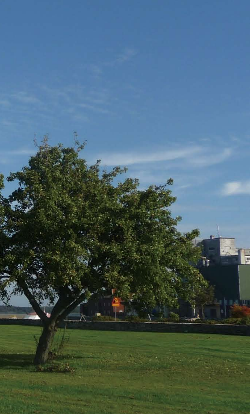
Installation in Mörbylång, Sweden

置しないで!」という人々の意見を「小型風力発電で、家の庭にちょっとしたツイストを効かせようか」と考えを一変させることができる製品の提案である。見た目が美しく洗練され、良く作り込みがされた風力発電ソリューションは、純粋に機能を果たすだけで、飾り気のない製品が主流の小型風力発電市場に一石を投じるに違いない。InnoVentum社は、審美性の高いタワーと、最新で安定したオペレーションを行う小型風力発電機を組み合わせ提供する努力を惜しまない。小型風力発電ソリューションは、いまだかつてない、美しく機能的という段階に突入したのだ。InnoVentum社の社訓は、アート、イノベーション、